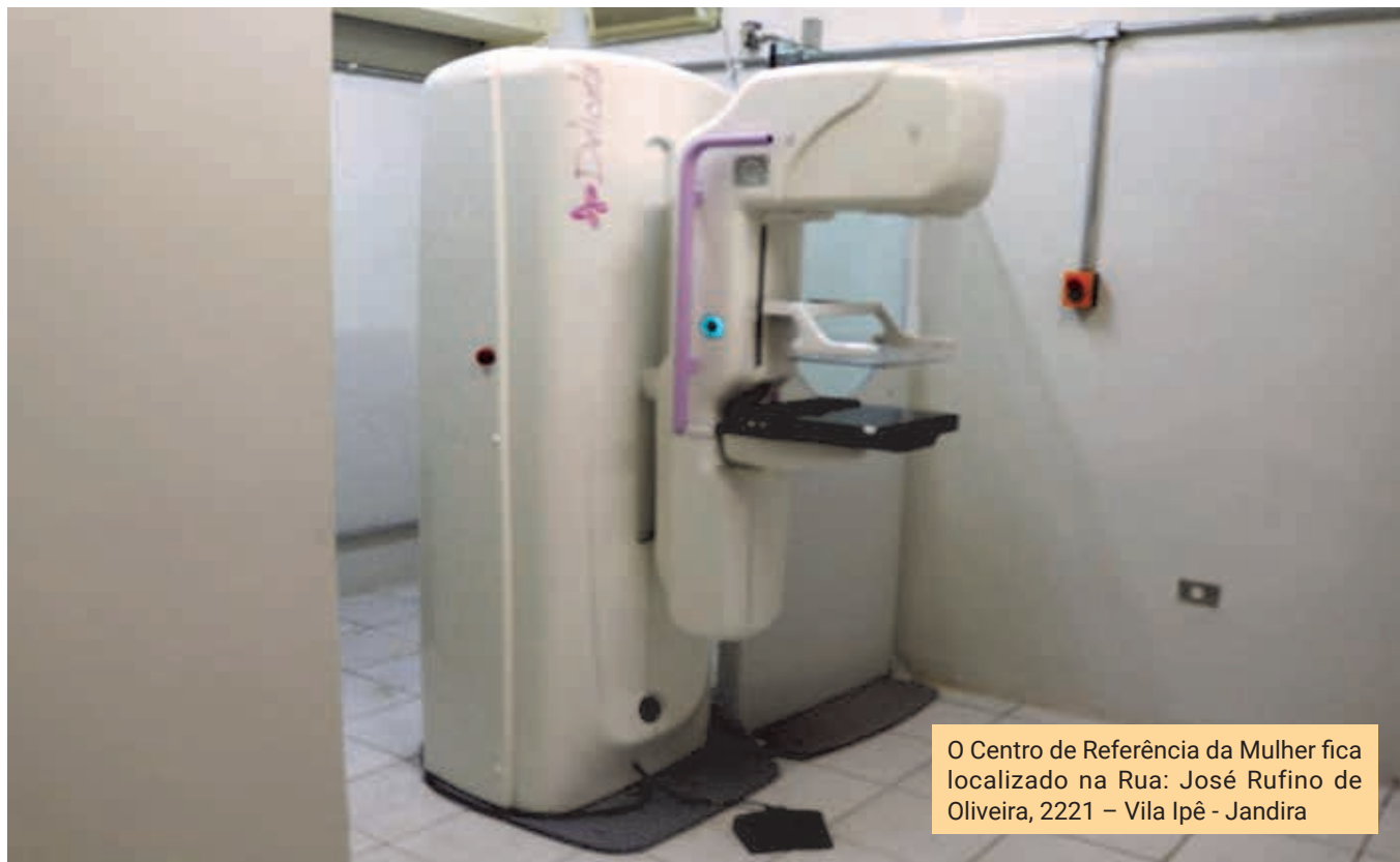
O Centro de Referência da Mulher fica localizado na Rua: José Rufino de Oliveira, 2221 – Vila Ipê - Jandira

O câncer de mama é um assunto muito sério, e é de suma importância a realização da mamografia